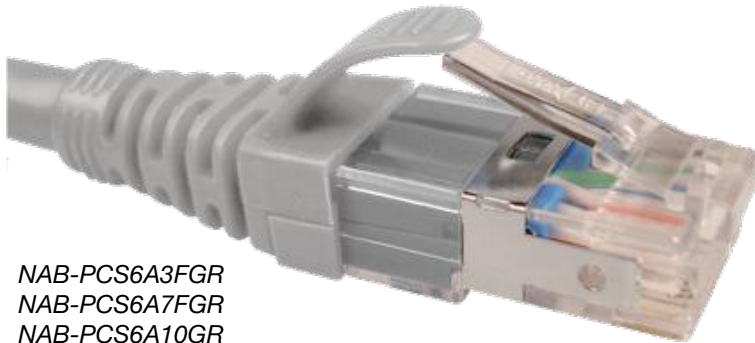
NAB-PCS6A3FGR NAB-PCS6A7FGR NAB-PCS6A10GR