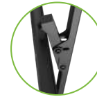
Sistema de agarre fácil y efectivo