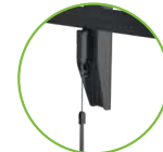
Mecanismo de liberación y bloqueo al instante